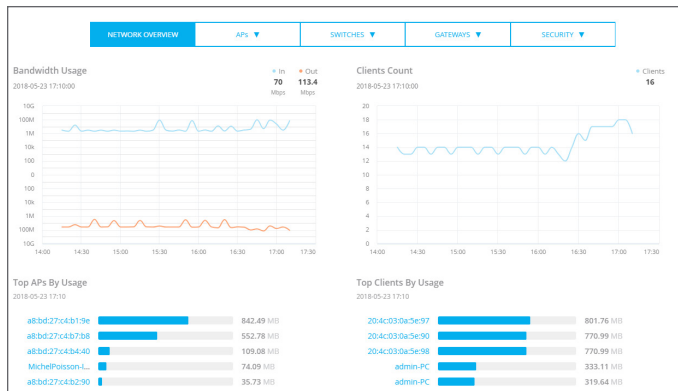
Figura 1: Supervisión del estado y el uso

También se proporciona una supervisión y control simplificados de puertos de enlace de cabecera y sucursal a través de la gestión integrada de WAN definida por software (SD-WAN). Los flujos de trabajo inteligentes brindan la capacidad de examinar configuraciones específicas de dispositivos, políticas o circuitos para garantizar que el rendimiento de la sucursal se alinee con las expectativas del negocio y del usuario.