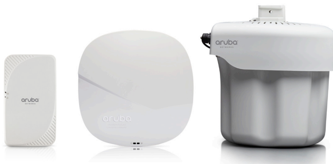
Aruba Access Points 205H, 325 y 275