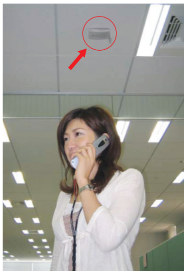
アクセスポイント設置の様子と使用風景