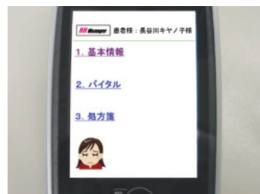
開発中の業務アプリケーション画面のサンプル