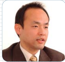
株式会社インターネットイニシアティブ ネットワークインテグレーション部

ネットワーク・ソリューション・プロバイダ(以下、NSP)としての事業を積極的に強化しているインターネットイニシアティブ(以下、IIJ)。同社では、その事業の核ともいえる無線LANのプラットフォームに、集中管理機能やセキュリティ機能などを備えるアルバイヤレスネットワークスの無線LANスイッチングシステム及びアクセスポイントを採用。アルバ製品と独自のネットワーク管理ツールを組み合わせ、「広域無線イーサネットソリューション」を提案するなど、アルバの革新的な無線LANソリューションが、IIJの事業拡大に一役買っている。