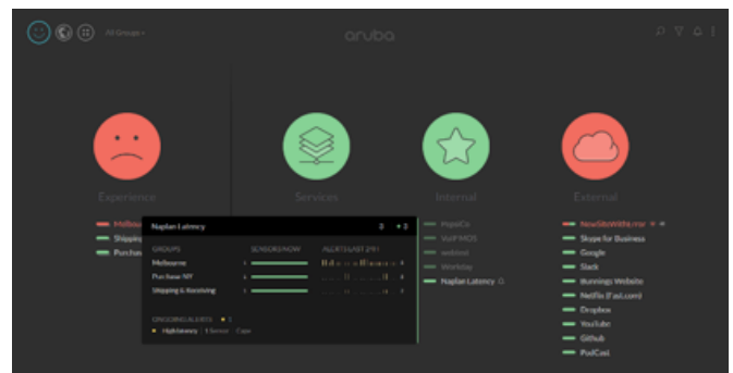
Figura 2: Información sobre la experiencia del usuario de Aruba: Panel del administrador