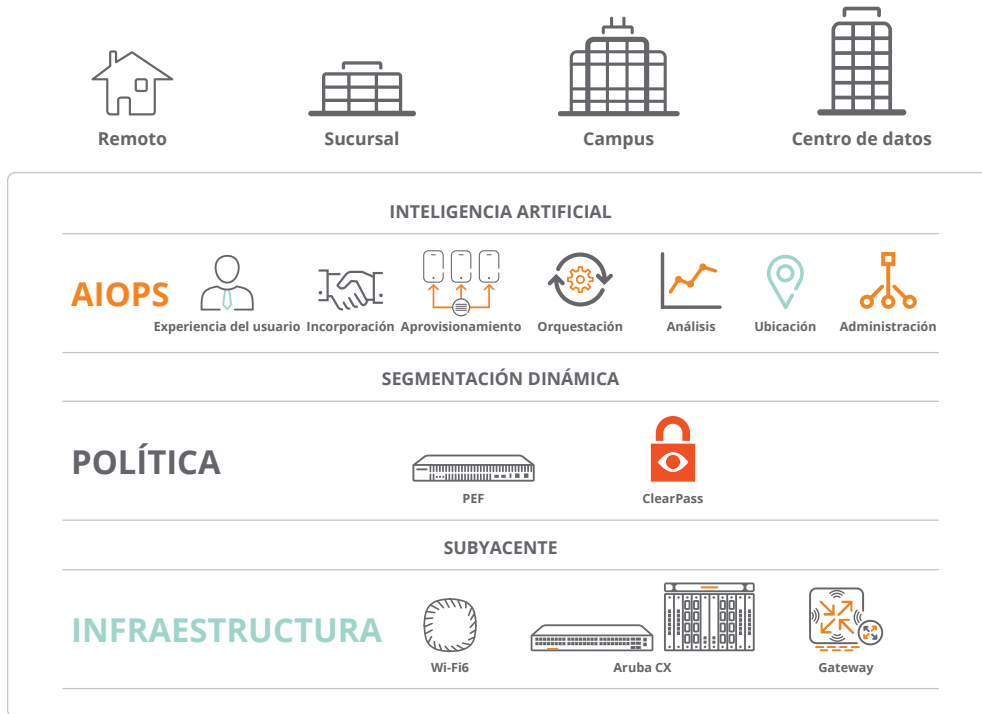
Figura 1: Infraestructura unificada de Aruba

POSIBILITAR UNA INFRAESTRUCTURA UNIFICADA