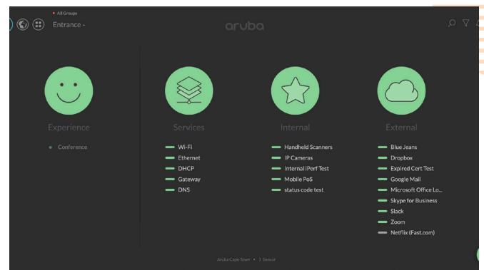
Figura 3: El panel de UXI de Aruba

Además, a medida que DevOps y otras metodologías ágiles de implementación continúan ganando terreno, los equipos de redes necesitan información inmediata para saber si las aplicaciones nuevas o actualizadas están rindiendo tal como se esperaba. UXI de Aruba brinda niveles agregados de aseguramiento. Las alertas determinan qué ubicaciones o grupos de usuarios están experimentando un rendimiento no óptimo para que la TI pueda priorizar sus correcciones.